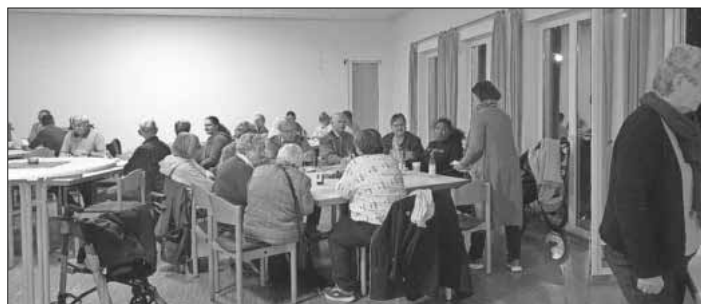
Das Lichterfest in der katholischen Kirche St. Marien in Köndringen war gut besucht.