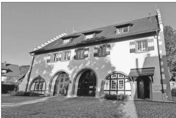
Das Alte Schloss in Heimbach.

Anmeldung bis 24. September per E-Mail: geraldoleisi@web.de. Die Teilnehmerzahl ist begrenzt.