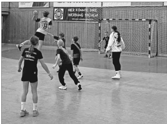
Die Kinder beim Herbstferienprogramm.

Weitere Infos zu den SpoFunnis sind auf der Homepage www.spofunnis.de zu finden.