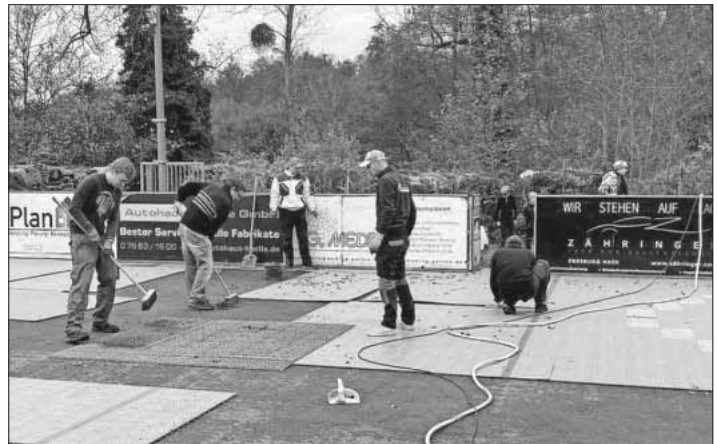
Am Samstag trafen sich zahlreiche Helfer zum Säubern des Hockeyplatzes. Langfristig soll eine Überdachung helfen, die Instandhaltungsarbeiten zu reduzieren.

Zum Ende des Jahres veranstalten die Crocodiles am 29. November am Hockeyplatz in Nimburg den dritten Glühweinhock. Für das leibliche Wohl ist gesorgt, die musikalische Begleitung übernimmt wieder der Musikverein Nimburg-Bottlingen und bei trockener Witterung kann auf dem Hockeyplatz bei vorweihnachtlicher Beleuchtung geskatet werden. Die Crocodiles freuen sich auf zahlreiche Besucher.