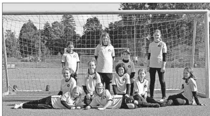
Die Juniorinnen des JFV Untere Elz.

Niederlage der D2-Junioren: Für die D2 war vergangenen Samstag nichts zu holen. Der SV Kenzingen war von Beginn an das bessere Team und lag früh mit 2:0 vorne. Gegen Ende der ersten Halbzeit konnte man das Spiel ein bisschen ausgeglichener gestalten, leider ohne zählbaren Erfolg. Nach dem Wechsel das gleiche Bild. Die D1 des SV Kenzingen erhöhte auf dem heimischen Rasen schnell auf 4:0. Das JFV-Team konnte nicht verhindern, dass der sehr robust spielende Gegner zum 6:0-Endstand erhöhte. Dennoch muss man der Mannschaft ein großes Lob aussprechen, das bis zum Schluss diszipliniert weiter spielte. Das Team wird diesen Rückschlag verarbeiten und dann beim nächsten Spiel in zwei Wochen gegen die SG Breisgau alles daran setzen, drei Punkte einzufahren.