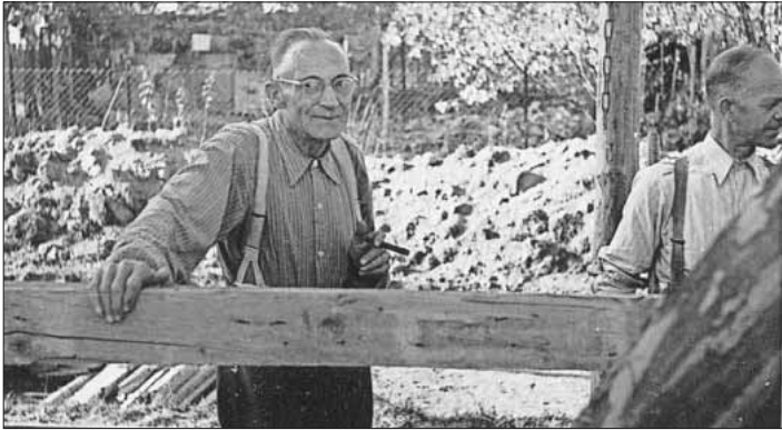
Arbeiten an der Marienkirche.