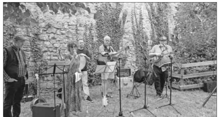
Die Band „Last Order“.