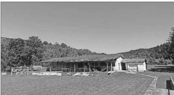
Das neu bedachte Vereinsheim des SV Heimbach mit Photovoltaikanlage.