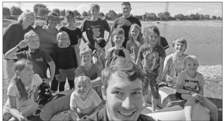
Jungmusiker aus Teningen beim gemeinsamen Baggerseewochenende in Riegel.

Weitere Informationen zur Jungmusikerausbildung findet man auf der Homepage www.mfk-teningen.de .