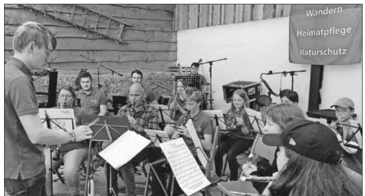
Die Nachwuchsmusikanten der Musik- und Feuerwehrkapelle bei ihrem Auftritt beim Jubiläumsfest des Schwarzwaldvereins Teningen.

Am vergangenen Sonntag folgte die Jugend der Musik- und Feuerwehrkapelle Teningen der Einladung des Schwarzwaldvereins Teningen und eröffnete deren 50. Jubiläum. Die Zuhörer bekamen ein abwechslungsreiches Programm zu hören. Von bekannten Filmmelodien bis Popsongs war alles dabei. Nach einer Stärkung beim reichhaltigen Essensangebot auf dem Ramstalhof konnten sich die Kinder auf der Strohbürg vergnügen. Auch schon der Wandergottesdienst im Vorfeld des Jubiläums wurde von drei Musikern begleitet. Die Musik- und Feuerwehrkapelle Teningen bedankt sich beim Schwarzwaldverein Teningen für die Einladung und das tolle Fest.