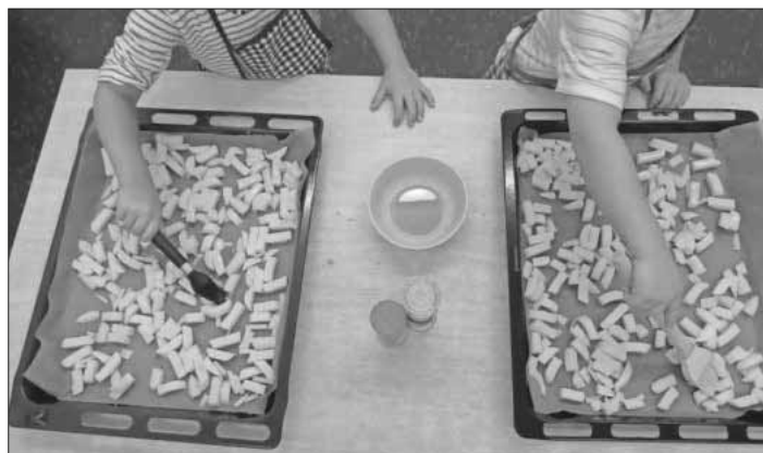
Die Kinder bereiten „Ofenpommes“ aus Kartoffeln zu.