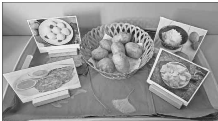
„Thementablett“ zur Kartoffel im Gruppenraum.