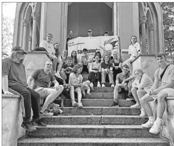
Die Teilnehmer am diesjährigen Erlebniscamp und Ferienprogramm der SpoFunnis.

Das nächste Ferienprogramm Sport&Fun steht in den Herbstferien zur Anmeldung bereit. Vom 28. bis 31. Oktober findet das Programm wie gewohnt in den Teninger Hallen statt. Infos und Anmeldung unter Telefon 07641 / 9379999 oder E-Mail: spuro@spofunnis.de.