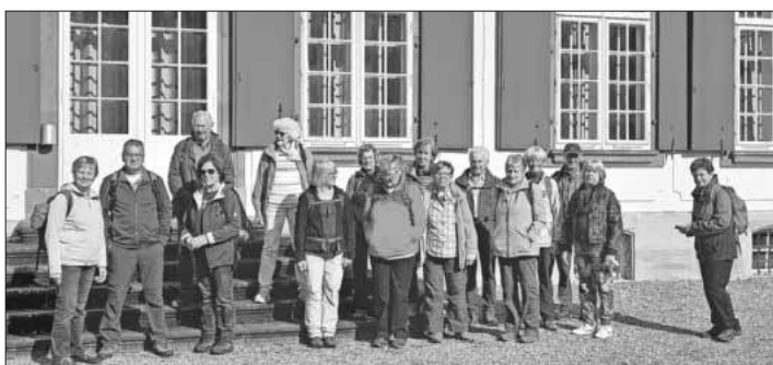
Die Wandergruppe vor der Villa Sandgrube.

Am Barfüsserplatz fand eine Einkehr mit Kaffee und Kuchen statt, den Abschluss bildeten das Münster und das Rathaus. Es war für alle ein informativer Wandertag. Bilder unter www.schwarzwaldverein-teningen.de .