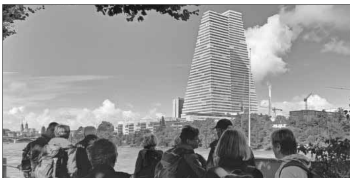
Die Hochhäuser der Firma La Roche.