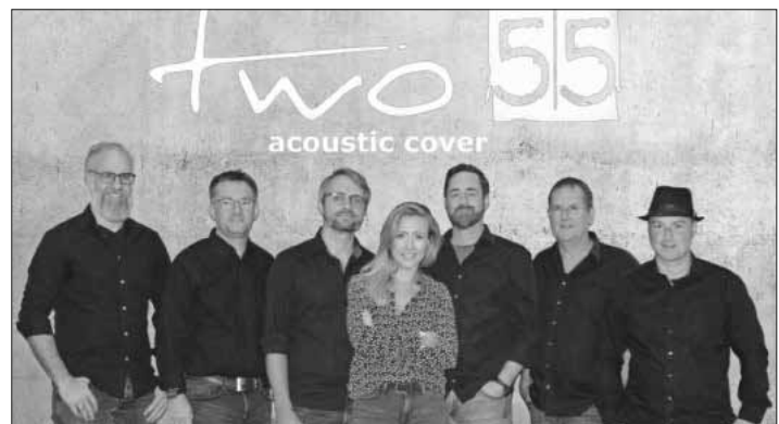
Die Band „two55“.

Vorbeikommen, Freunde schnappen und einen unvergesslichen Abend mit grandioser Live-Musik und köstlichen Drinks erleben, wenn der Heimbacher Löwe bebt!