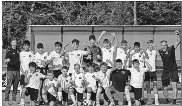
Die C1 Junioren nach ihrem Heimsieg.

10. Oktober, 18.15 Uhr in Eichstetten: SG Bötzingen - C1 Junioren.