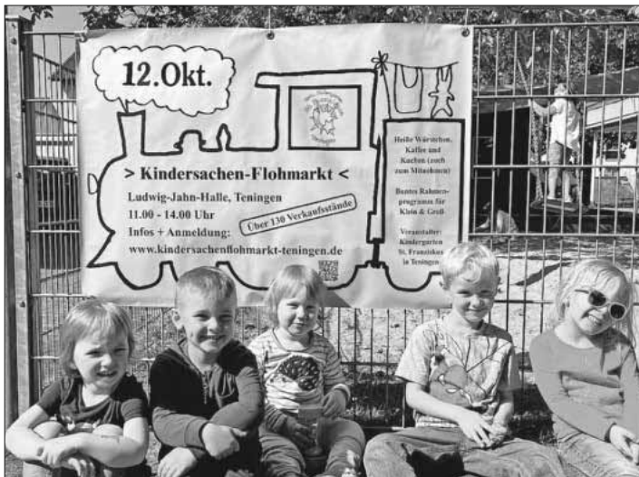
Die Kinder haben beim Aufhängen des Plakates geholfen.

Für die Aussteller und Besucher stehen reichlich Parkplätze rund um die Ludwig-Jahn-Halle zur Verfügung. Der Kindergarten St. Franziskus lädt alle, die gerne feilschen und stöbern, zum Flohmarkt-Bummel und gemütlichen Verweilen ein. Auch wer sich nur mit Kuchen fürs Wochenende eindecken möchte, ist herzlich willkommen. Sämtliche Einnahmen kommen zu 100 Prozent den Projekten des Kindergartens St. Franziskus und somit den Kindern zugute.