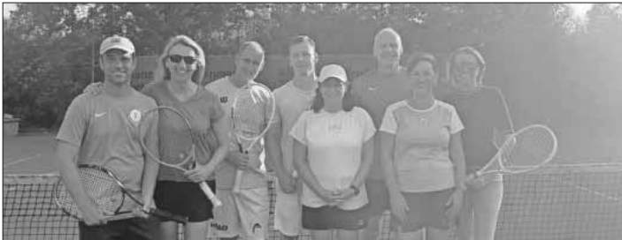
Das Foto zeigt die Mannschaft TCK – Mixed Mannschaft 40er.

Die Mixed-Mannschaft 40 beendete beim TC Wasser mit einem Auswärtssieg von 6:3 die Mixedrunde. Sie belohnte sich mit dem 2. Tabellenplatz punktgleich hinter der Spielgemeinschaft Rheinhausen/Wyhl/Weisweil, gegen die man mit 5:4 knapp verloren hatte. Beide Mannschaften erzielten, nach je einem verlorenem Spieltag, einen Gesamtpunktestand von 8:2 Punkten. Zum Abschluss entschied die Matchanzahl von nur einem Punkt die Meisterschaft.