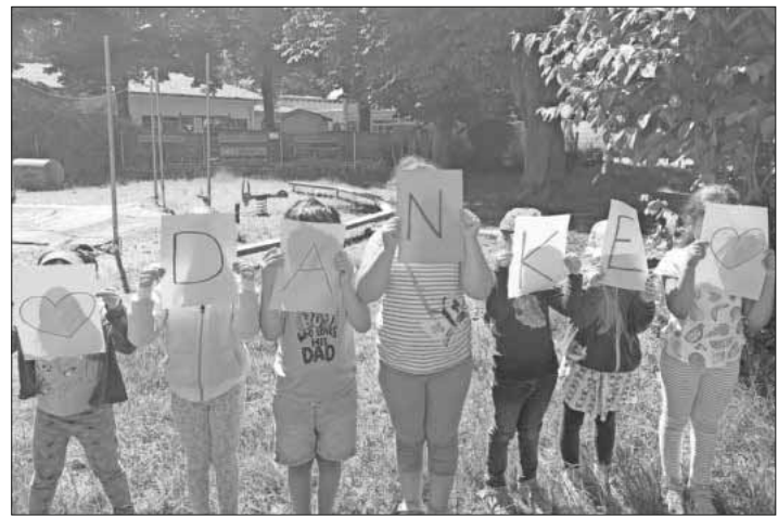
Die Kindergartenkinder sagen Danke.

Die Kinder des evangelischen David-Kindertages bedanken sich bei allen Spendern für die Matschanlage!