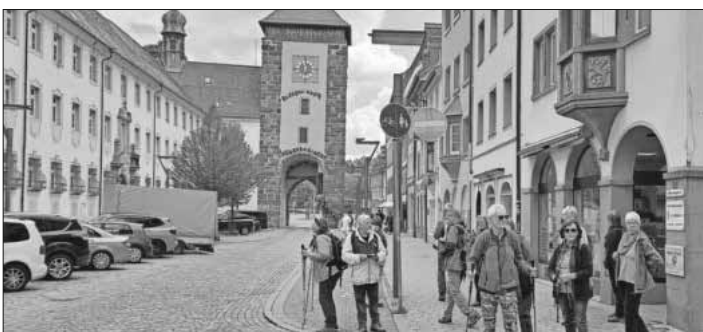
Die Wandergruppe in Villingen.

Die Wanderung führte durch die sehenswerte Altstadt mit seinen Stadtmauern, Türmen, Kirchen und Klosteranlagen und danach weiter zum Rosenpark Hubenloch. Auf dem Aussichtsturm hatte man eine schöne Aussicht über Villingen und Schwenningen. Nach der Vesperrast führte der Keltenpfad zum Fürstengrab Magdalenenberg, dem größten keltischen Grabhügel Mitteleuropas. Noch heute dominiert das 2.600 Jahre alte Fürstengrab mit seinen gewaltigen Ausmaßen die Landschaft. Weiter ging es entlang der Brigach wieder durch die Altstadt von Villingen zum Franziskanermuseum mit der Ausstellung der Keltenfunde. Die Fürstengrabteile und die Beigaben aus 126 Gräbern der Nachbestattungen, die ab 1890 durch archäologische Ausgrabungen gefunden wurden, konnten besichtigt werden. Es war für alle ein informativer, schöner Tag. Bilder unter: www.schwarzwaldverein-teningen.de .