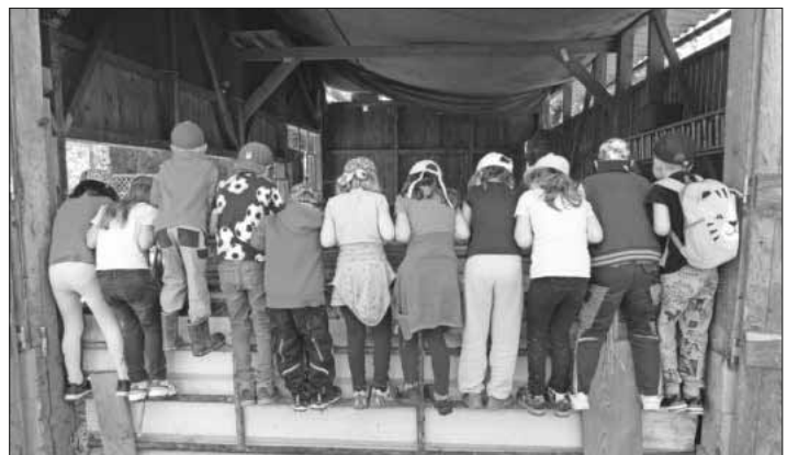
Die Schulanfänger auf dem Brupbach-Hof.