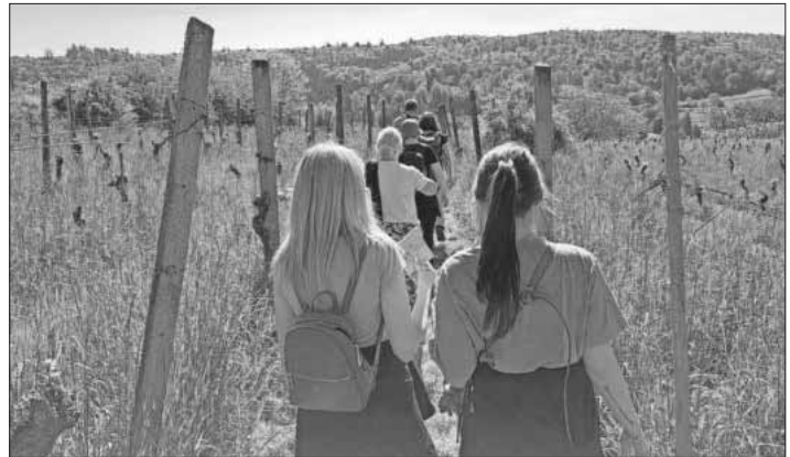
Das Erzieherinnenteam auf dem St. Gallus Rundweg.

Mitte Mai machten die Schulanfänger einen Ausflug zum „Brupbach-Hof“ in Heimbach. Dort gab es vielerlei über die Tiere zu erfahren, z.B. wieviel Wasser trinkt eine Kuh, ein Schwein, ein Mensch am Tag? Woran erkennt man, welche Hühner braune und welche weiße Eier legen? und vieles mehr. Anschaulich und kurzweilig wurde durch die Themen geführt und alle konnten die Tiere „hautnah erleben“, dazwischen wurde zur Stärkung gepicknickt. Kühe, Schweine, Ziegen, Schafe, Pfaue, Katzen, Hühner und Enten waren dort zu sehen und die Kinder wurden von den Tieren neugierig begrüßt. Die Erzieherinnen waren bei bestem Maiwetter gemeinsam auf ihrem jährlichen Betriebsausflug unterwegs. Nach einem kleinen „Brunch“ ging es unter fachkundiger Führung des Geschichts- und Bürgervereins Heimbach knapp elf Kilometer über „Stock und Stein“ durch die Wälder und Reben, um den St. Gallus Rundweg und somit Heimbach ein bisschen besser kennenzulernen. Den Nachmittag konnte man dann mit leckerem Essen und kühlen Getränken in der Nachmittagssonne ausklingen lassen. Weiteres kann man Ende Juni in dieser Rubrik erfahren.