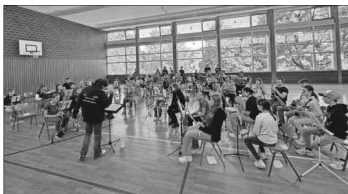
Jungmusiker aus Teningen, Köndringen, Heimbach, Nimburg-Bottingen und Malterdingen beim gemeinsamen Proben.

Direkt nach dem Probewochenende am Samstag, 25. Mai, fand auch schon für die Nachwuchsmusikanten der Musik- und Feuerwehrkapelle Teningen der zweite, gemeinsamen Probetag in diesem Jahr statt. Diesmal in Malterdingen. Geübt wurde für ein ganz besonderes Projekt. Gemeinsam mit den Jungmusikern aus der Winzerkapelle Köndringen, dem MV Heimbach, MV Nimburg/Bottingen und dem MV Malterdingen wurde ein Tag zusammen viele Stücke einstudiert. Zwischendurch wurden alle reichlich mit Nudeln und Bolognese, sowie Kuchen versorgt. Die Bekanntschaften wurden gestärkt und der Spaß am Musizieren ausgelebt. Die Jungmusiker, Dirigenten und Jugendleiter hatten sichtlich Spaß und freuen sich schon das große Konzert am 8. Juni. Dort präsentieren die 75 Jungmusiker ihr gemeinsames Ziel der Proben bei einem Benefizkonzert in der Ludwig-Jahn-Halle.