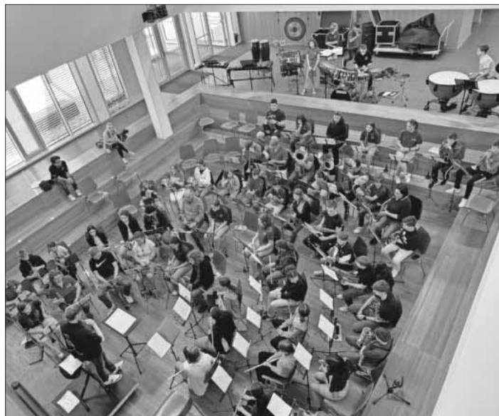
Die Jungmusiker der Musik- und Feuerwehrkapelle Teningen.

Die Jungmusiker der Musik- und Feuerwehrkapelle Teningen laden recht herzlich zum „Tag der Musik“ ein am kommenden Sonntag, 8. Juni. Dieser Tag wird ganz der Jugend und der Jungmusik gewidmet. Um 16.30 Uhr beginnt der Einlass in die Ludwig-Jahn-Halle in Teningen. Es werden die Teninger Bläserklasse, der Teninger Schulchor und die Jugend des Akkordeonvereins zu hören sein. Ab ca. 19 Uhr beginnt das große Benefizkonzert des Projektjugendorchesters, bestehend aus insgesamt 85 Jungmusikern aus den befreundeten Musikvereinen aus der Umgebung. Mit dabei sind Jungmusiker aus Köndringen, Heimbach, Nimburg-Bottingen, Malterdingen und Teningen. Die Jungmusiker präsentieren hier mit Stolz ihre eingeübten Stücke. Es wird bekannte Filmmusik und Popmusik zu hören sein, die jeder kennt. Der Eintritt ist frei und die eingenommenen Spenden gehen an die Lebensmission Haiti. Weitere Infos darüber werden am Konzerttag verkündet. Für Bewirtung ist gesorgt. Auch ein Quiz mit tollen Preisen rundet den Abend ab. Die Bevölkerung sowie alle interessierten Kinder und Jugendlichen sind herzlich eingeladen.