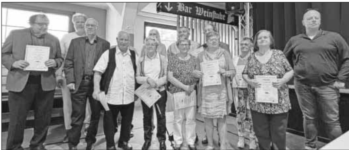
Einige Mitglieder wurden für 10- und 25 Jahre VdK-Treue geehrt.