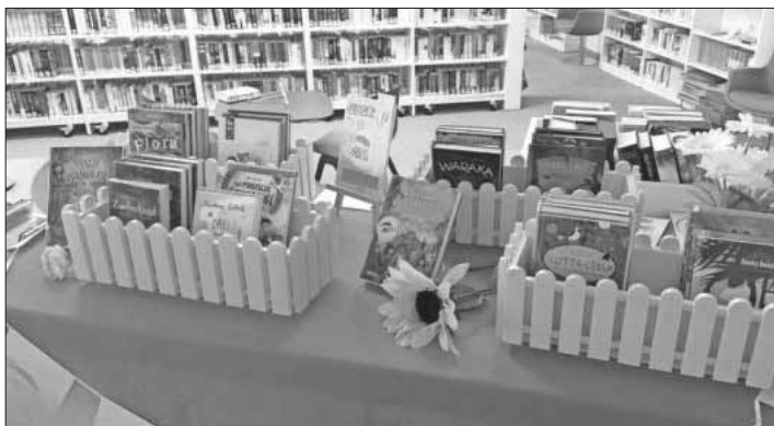
Bei der Sommerleseaktion „Heiß auf Lesen“ stehen neu angeschaffte Bücher zur Ausleihe bereit.

Die Öffnungszeiten der Mediathek: Schulintern Montags-Freitags 12 bis 14 Uhr, für die Öffentlichkeit dienstags bis freitags von 14 bis 17. Die Öffnungszeiten während der Sommerferien werden noch gesondert bekannt gegeben.