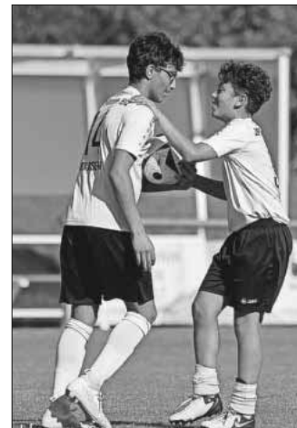
Jubel bei den C1-Junioren über das Remis.