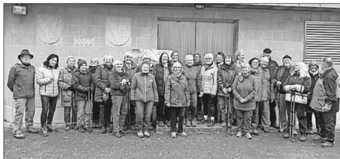
Viele Informationen erhielten die Teilnehmer bei der Gesundheitswanderung durch die Teningen Allmend.