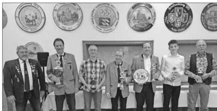
Die Gewinner der Wanderpokale.