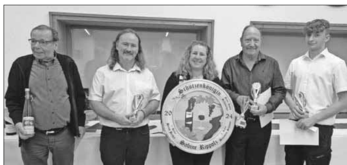
Die neue Königsfamilie.

Der Königsball 2024 war auch durch das perfekte Catering ein voller Erfolg und wird allen Beteiligten sicherlich in guter Erinnerung bleiben. Herzlichen Glückwunsch an alle Gewinner und ein großes Dankeschön an alle Helfer und Organisatoren, die diesen Abend möglich gemacht haben.