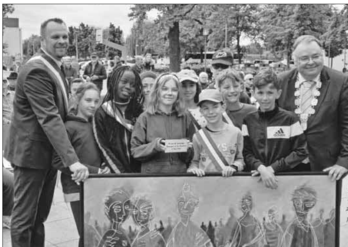
Die Partnergemeinde La Ravoire schenkte der Gemeinde Teningen ein Bild.