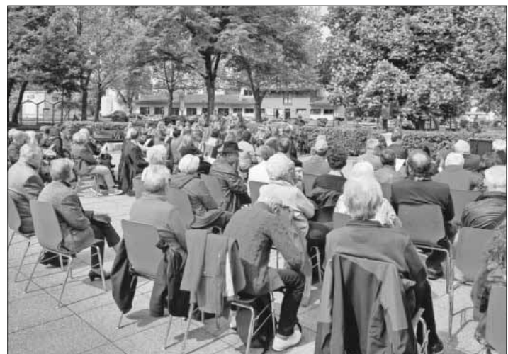
Das Jubiläum war gut besucht.