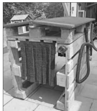
Tank- und Waschanlage für Fahrzeuge.

Vorletzte Woche am Freitag und Samstag fanden die Aktionstage in der Teninger Kindertagesstätte „Spatzennest“ statt. Der Schwerpunkt der diesjährigen Aktion lag auf der Gestaltung des Außenbereichs. So haben an beiden Tagen Groß und Klein fleißig gesägt, gegraben, gepflanzt und geputzt. Am Ende konnten viele tolle Ergebnisse, wie eine Matschküche, eine Tank- und Waschanlage für Fahrzeuge oder auch ein neu angelegter Sandkasten bestaunt werden. Außerdem