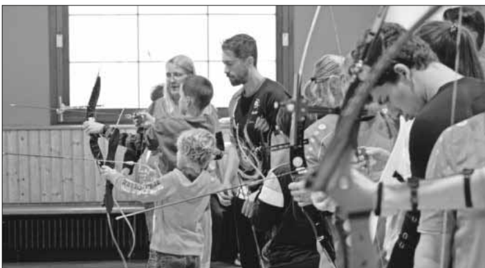
Bogenschießen in der Winzerhalle.

Einigen „Robin Hoods“ scheint der Sport so viel Spaß gemacht zu haben, dass sie sogar schon das erste offizielle Halentraining besucht haben.