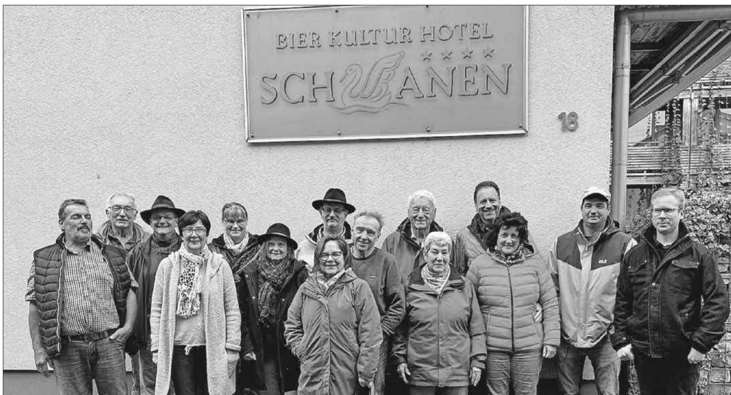
Die Teilnehmer des Vereinsausfluges.

wurden auf unterhaltsame Weise Informationen zur Geschichte und Entwicklung der Stadt erzählt. Am Nachmittag stand ein Ausflug zum nahegelegenen Schloss Mochenhof auf dem Programm. Bei einer Führung wurden das Schloss, die umliegende Landschaft und die aktuelle Kunstgalerie besichtigt. Moderne Kunstwerke überraschten durch ihre Ausstrahlung und Preise. Im Schloss-Café stärkten sich die Schützen bei Kaffee und Kuchen. Ein weiteres Highlight am Samstag war die Führung durch die hoteleigene Brauerei, bei der ein Bierbraumeister das Handwerk des Bierbrauens erklärte. Eine Verkostung der Brauerzeugnisse direkt aus dem Fass rundete die Führung ab. Der Abend klang bei einem gemütlichen Brauerei-Abendessen aus. Am Sonntag trat die Gruppe die Heimreise an. Der Vereinsausflug bot eine gelungene Mischung aus Kultur, Geschichte und Genuss, die den Teilnehmern noch lange in Erinnerung bleiben wird.