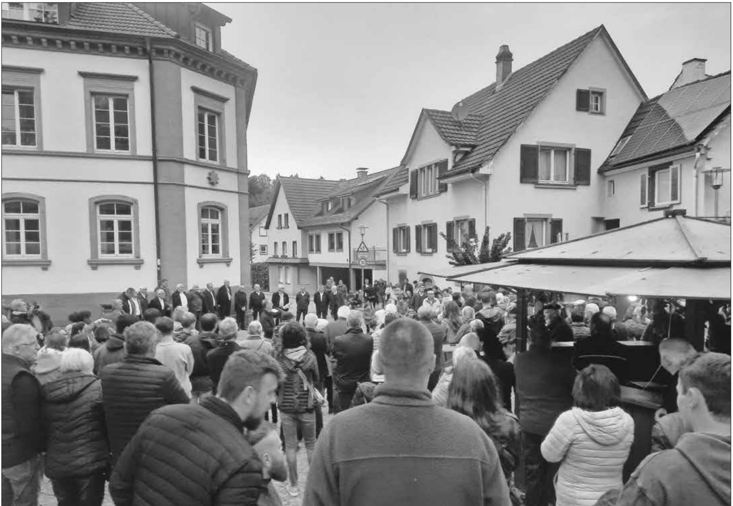
Gut besucht war die Kilwi zum Fassanstich am Samstag.

Schnitzel mit Pommes frites und Sauerbraten mit Nudeln. Auch Spaghetti Bolognese und Napoli sowie Gemüseragout, verschiedene Salate und heiße Würstchen standen auf den Speisekarten. In der Anton-Götz-Halle wurde mit Kaffee und Kuchen bewirtet. Neben Weinen, Bier und alkoholfreien Getränken gab es auch verschiedene Cocktails und Longdrinks. Ein besonderes Programm stellten die Vereine für die Jüngsten auf die Beine: am Nachmittag bot der Turnverein Heimbach ein buntes Kinderprogramm mit Schminken und Tattoos auf dem Schulhof, wo es auch ein Spielmobil und ein Märchenkarussell gab.