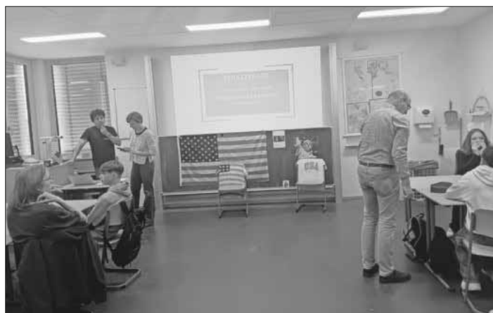
Quiz: „Das Rennen ums Weiße Haus.“

Zwei Mitarbeiter der Landeszentrale für politische Bildung aus Freiburg führten mit den Schülern im „amerikanisierten“ Klassenzimmer ein interessantes sowie lehrreiches Quiz zu den anstehenden Wahlen in den USA durch. Dabei wurde die Klasse in gleich große Gruppen aufgeteilt. Nach Klärung der Spielregeln ging es auch sofort los. Mit großem Eifer machten sich die Jugendlichen daran, die teilweise doch sehr herausfordernden und kniffligen Fragen zu beantworten. Dabei machte sich die gute Vorbereitung im Gemeinschaftskunde- und Englischunterricht positiv bemerkbar. Am Ende musste bei Gleichstand von zwei Teams durch eine Schätzfrage der Gewinner des Quiz ermittelt werden. Die überglückliche Siegerinnengruppe konnte dann im Anschluss ihre Preise in Form von allerlei Originalgoodies aus den USA entgegennehmen. Das Fazit aller Beteiligten war, dass der Nachmittag äußerst interessant sowie kurzweilig verlief und auch noch einige neue Aspekte, Informationen und Fakten über das Wahlsystem in den USA gelernt wurde. Die Schüler würden es auch sehr begrüßen, wenn so eine Aktion bald mal wieder in der Theodor-Frank-Schule stattfinden würde. Die Schule war hoch zufrieden, dass diese Aktion durchgeführt werden konnte, zumal nach Auskunft der Landeszentrale für politische Bildung Freiburg wegen des enorm hohen Interesses an die 200 Absagen an andere Schulen verschickt werden mussten.