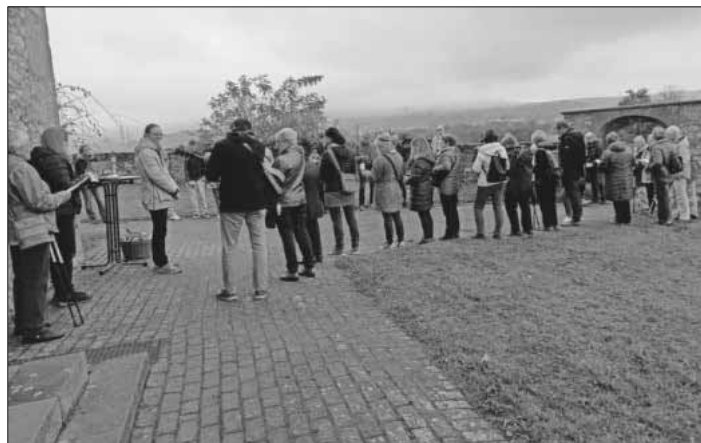
Teilnehmer des Spaziergottesdienstes.