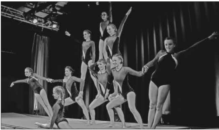
Turnerinnen des TV Köndringen.

Am Samstag, 2. November, verwandelt sich die Winzerhalle in Köndringen in eine Bühne für spektakuläre Auftritte und sportliche Hochleistungen. Die verschiedenen Turn- und Tanzgruppen haben sich über Wochen auf diesen besonderen Abend vorbereitet und präsentieren ein abwechslungsreiches Programm aus Turn- und Tanzeilagen. Neben den Turnerinnen und Turnern in Bestform wird auch die Showgruppe, die sich aus ehemaligen und aktuellen Mitgliedern unterschiedlicher Altersklassen zusammensetzt, ihr Können zeigen. Mitreißende Musik, bunte Outfits und energiegeladene Zumba- und Jazz-Tänzerinnen und -Tänzer sorgen für ausgelassene Stimmung. Für das leibliche Wohl der Gäste ist ebenfalls bestens gesorgt mit einer Auswahl an Speisen und Getränken. Die Abteilung Turnen freut sich am 2. November auf viele interessierte Besucher, die den Abend gemeinsam genießen möchten. Einlass in die Winzerhalle ist um 19 Uhr. Karten sind ausschließlich an der Abendkasse erhältlich.