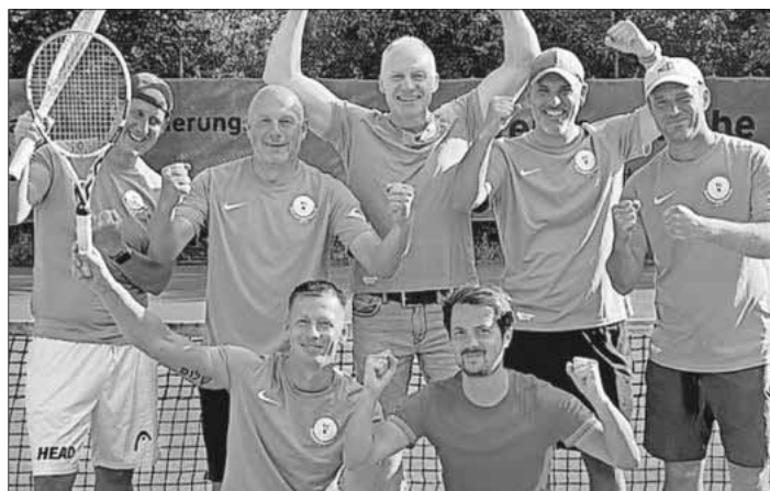
Die Herrenmannschaft 40 des Tennisclubs Köndringen.

Damen: Die TSG-Damen Köndringen/Teningen/Heimbach mussten vor zwei Wochen auf heimischem Platz gegen die TSG Bohlsbach/Weier/Gengenbach antreten. Sie erspielten sich hier einen klaren 8:1-Sieg heraus. Am vergangenen Sonntag reiste man als Tabellenzweite zum Auswärtsspiel nach Endingen. Auch hier ließ die TSG nichts anbrennen und konnte sich ebenfalls mit einem klaren Auswärtssieg von 8:1 durchsetzen. Da der Tabellenführer Waltershofen gegen Ettenheim mit 4:5 patzte, schob man sich punktgleich, aber mit einem deutlich besseren Satzverhältnis auf Platz 1 und schaffte so, wenn auch hauchdünn, den verdienten Aufstieg in die 1. Bezirksklasse.