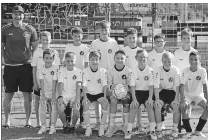
D1- und D2-Junioren des JFV Untere Elz.