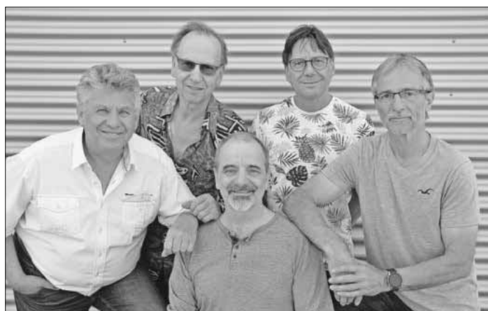
Die Band Andromeda.

Für kühle Getränke sorgt der Kulturverein Teningen und freut sich über Spenden! Der Eintritt ist frei.