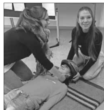
Die Teilnehmer üben die Helmabnahme eines Radfahrers.