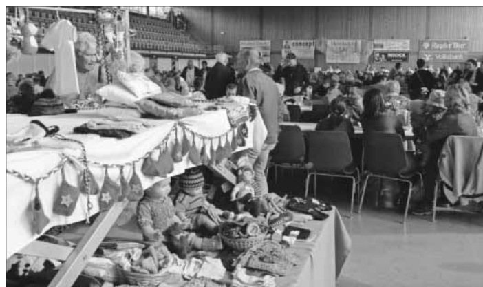
Rotkreuz-Basar: Einkaufen und gemütliches Beisammensein.

Nach dem Motto des DRK „Menschen helfen, Gesellschaft gestalten“ will man den Wohltätigkeitsbasar nun in diesem Jahr wieder zum Erfolg werden lassen, um den Erlös der Veranstaltung einem wohltätigen Zweck zukommen zu lassen. Deshalb freut sich das Deutsche Rote Kreuz, Ortsverein Teningen, auch jetzt schon darüber, seinen Besuchern einen schönen Tag am 1. November bereiten zu können. „Aus Liebe zum Menschen.“