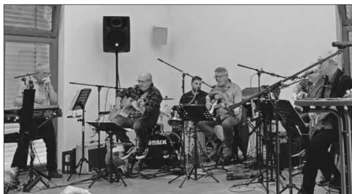
Die Band SpätZünder aus Heimbach.

Der Kulturverein bedankt sich ganz herzlich bei all seinen Helferinnen und Helfern sowie allen Unterstützern. Insgesamt ein tolles Fest, welches die Vorstandschaft des Kulturvereins ermutigt, sein kulturelles Engagement im Dorf weiter fortzusetzen.