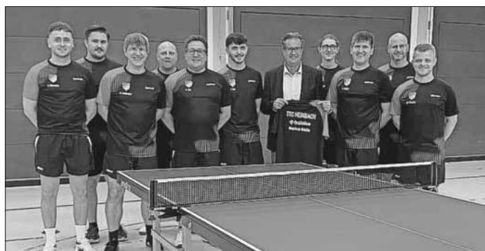
Die erste und zweite Mannschaft des TTC Heimbach in ihren neuen Trikots.