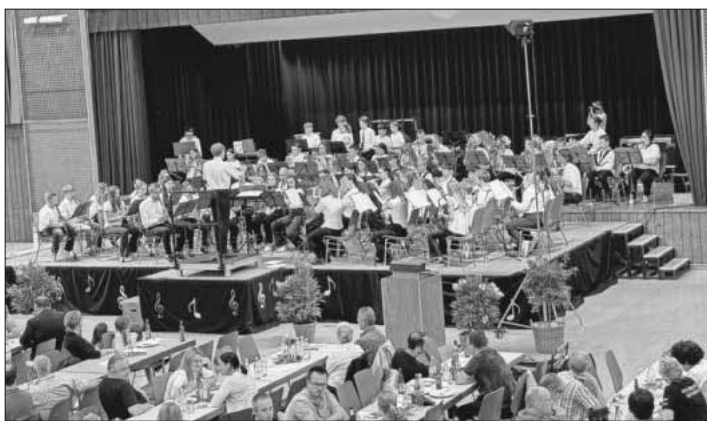
Die Musik- und Feuerwehrkapelle Teningen beim Benefizkonzert „Tag der Musik“.

Vergangenen Samstag fand der „Tag der Musik“ in der Ludwig-Jahn-Halle statt. Ab 16.30 Uhr füllte sich die Halle. Den Konzertabend eröffnete die Bläserklasse aus Teningen und Nimburg. Zum ersten Mal standen die Jungmusiker auf der Bühne und präsentierten stolz ihr Können. Anschließend wurde das Publikum vom Schulchor der Teningen Grundschulen unterhalten. Auch die Jugend der Akkordeonspielgemeinschaft Eichstetten/Teningen nahm auf der Bühne Platz. Die Jungmusiker des Projektorchesters konnten es kaum abwarten, bis sie an der Reihe waren. Um 19 Uhr kam nun das Projektjugendorchester, bestehend aus insgesamt 75 Jungmusikern aus den befreundeten Musikvereinen aus der Umgebung, dran. Mit dabei waren Jungmusiker aus Köndringen, Heimbach, Nimburg-Bottingen, Malterdingen und Teningen. Sie präsentierten voller Stolz ihre eingeübten Stücke. Durch das Konzert führten die Jungmusiker mit selbstgeschriebenen Ansagen. Besonderes Highlight war der Cup-Song, bei dem zu Beginn einige Musiker einen Rhythmus mit einer Becher-Choreografie vorgaben. Das Schlagzeug setzte den Rhythmus an allen vorhandenen Trommeln fort und ein Trompetensoli kam auch noch dazu. Abgerundet wurde der Abend durch ein musikalisches Quiz mit ein paar tollen Preisen. Die Musik- und Feuerwehrkapelle dankte den Besuchern und Spendern. Die eingesammelten Spenden kommen dem Kinderdorf in Haiti zugute.