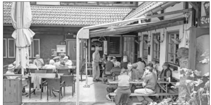
Die Wanderinnen und Wanderer bei der längeren Rast auf dem Bergbauernhof.

Am Sonntag (9. Juni) hieß es nach dem Frühstück Abschied nehmen mit „Grosses bises“ und „Auf Wiedersehen“ bei den nächsten Treffen, sei es vom 21. bis 23. Juni im Pays de Saint-Marcellin (Isère), bei der 40-jährigen Verschwisterungsfestlichkeit vom 27. bis 29. September in La Ravoire und im Mai nächsten Jahres zur Wanderwoche im französischen Jura.