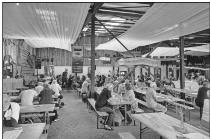
Das Jubiläumsfest des Schwarzwaldvereins war sehr gut besucht.

Das Ergebnis konnte sich sehen lassen: Bei einer Tombola und einem Schwarzwaldquiz konnte man am Samstag Sachpreise gewinnen. Wanderführer boten am Info-Mobil des Schwarzwaldvereins. Für die Kleinsten gab es neben einem Spielplatz einen kleinen Streichelzoo sowie die Möglichkeit, Lesezeichen, Kräutersalze und Buttons zu basteln oder nach Herzenslust zu malen. Doch auch kulinarisch war Einiges geboten: Badische Spezialitäten wurden direkt vom Team des Ramstalhofes angeboten, der Schwarzwaldverein bewirtete mit Kaffee und Kuchen. Vor Ort konnte außerdem der Jubiläumshonig erworben werden.