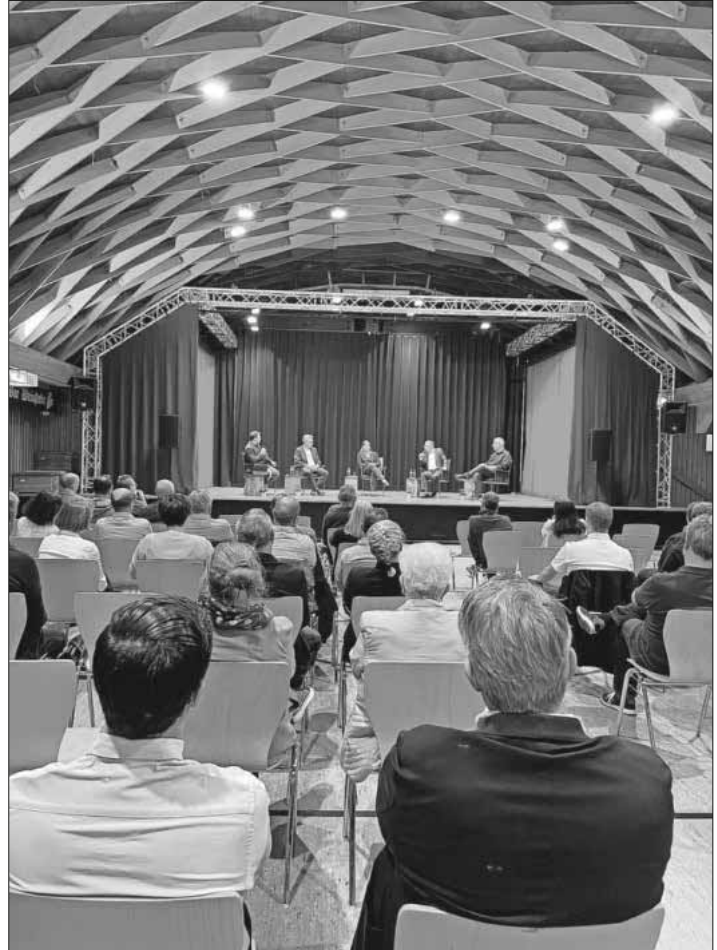
Das Wirtschaftsforum in der Winzerhalle in Köndringen war gut besucht.