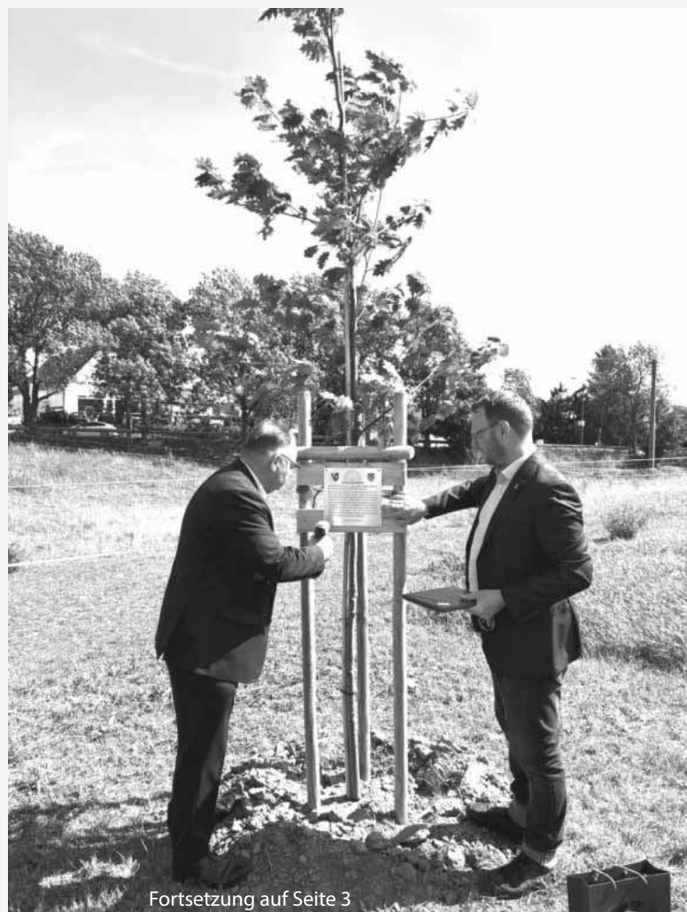
Fortsetzung auf Seite 3

Auch in unserer Gemeinde spüren wir, wie wichtig Zusammenhalt ist. Gerade im Austausch mit den Freunden in unserer Partnergemeinde Zeithain in Sachsen habe ich dies beim dortigen Besuch vor vier Wochen gespürt.