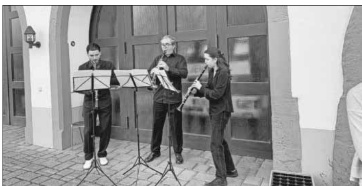
Das Trio Miorado.