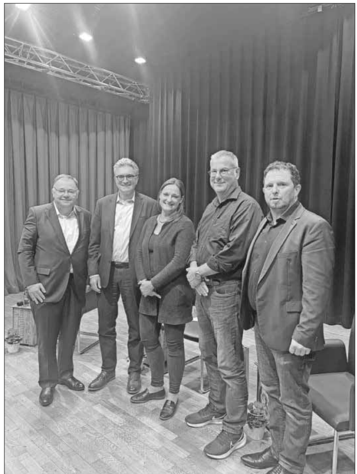
Die Redner des Podiumsgesprächs.