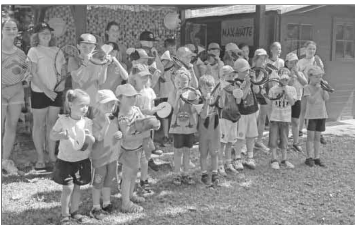
Die Teilnehmer der Ferienaktion des Musikvereins und des Tennis-Clubs.