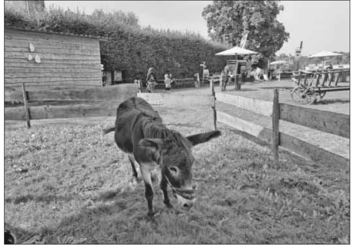
Für die Kinder gab es einen Streichelzoo.