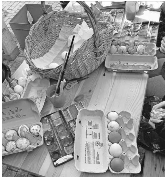
Von Kindern der Bastelecke verzierte Ostereier.

Für die Bereitstellung des Altpapiers will man sich natürlich auch bei der Bevölkerung herzlich bedanken. Mit dem Geld der Sammlung werden Aktionen für die Schüler wie Ausflüge, Klassenfahrten, Theaterbesuche usw. unterstützt. Danke an jeden, der sich beteiligt hat.