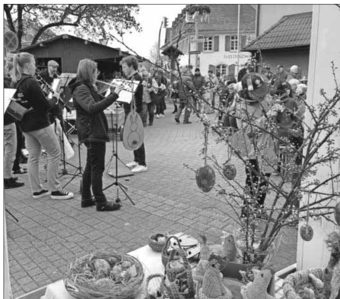
Musik von der Winzerkapelle Köndringen.

Natürlich war auch für das leibliche Wohl gesorgt, mit leckeren Kuchen und Torten aller Art, Flammenkuchen, Nudelsuppe, Weinen und vielem mehr wurden die Besucher kulinarisch verwöhnt. Musikalisch wurde der Markt durch eine Abordnung der Winzerkapelle Köndringen bereichert.