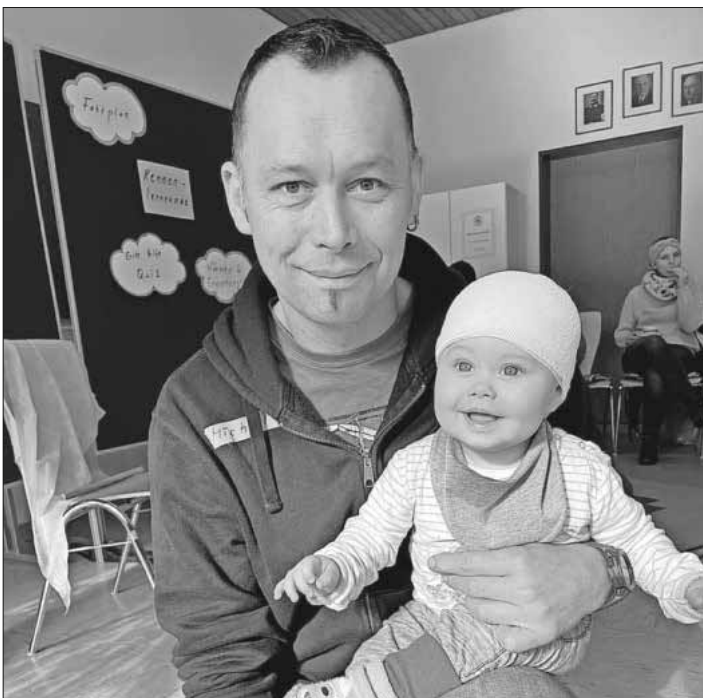
Erwachsene und Kinder sind beim Kindernotfallkurs herzlich willkommen.

Anmeldungen sind möglich unter Telefon 07641 / 9225-0 sowie per E-Mail an info@vhs-em.de oder im Internet unter www.vhs-em.de.