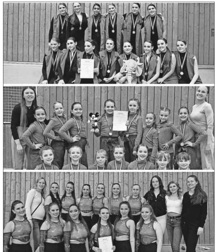
Von oben: Joukko, Connect und Effect bei der Siegerehrung.

Das Jazz-Modern/Contemporary-Turnier in Teningen war nicht nur eine gelungene Veranstaltung für Tanzsportbegeisterte, sondern zeigte auch das Engagement und die Leidenschaft, die in der lokalen Tanzsportszene von Teningen stecken. Die herausragenden Leistungen der Formationen machen deutlich, dass die Zukunft von Jazz und Modern/Contemporary im TSC Teningen vielversprechend ist.